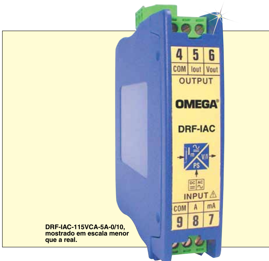
DRF-IAC-115VCA-5A-0/10, mostrado em escala menor que a real.

Proteção do intervalo: 7,5 A para intervalos maiores que 500 mA e menores ou iguais a 5 A, 750 mA para intervalos menores ou iguais a 500 mA