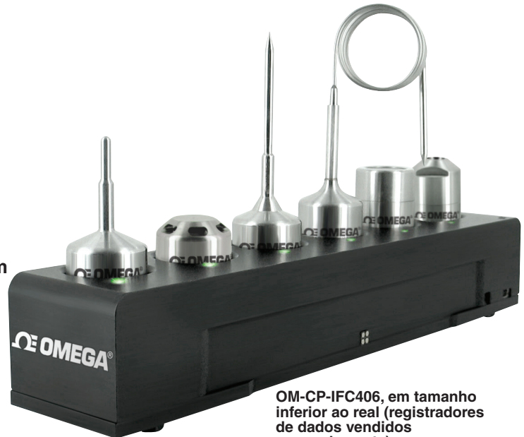
OM-CP-IFC406, em tamanho inferior ao real (registradores de dados vendidos separadamente)

Ambiente de Operação: 10°C a 35°C (50°F a 95°F); 0 a 95% da UR, não condensante