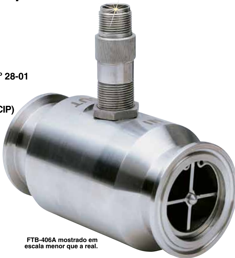
FTB-406A mostrado em escala menor que a real.

O medidor de vazão de turbina de projeto sanitário da Série FTB400 da OMEGA é aceito no padrão sanitário 3-A n° 28-01 para medição de líquidos de processo onde são necessários altos padrões sanitários. O medidor está disponível nos tamanhos de ¼ a 3" com encaixe padrão Tri-Grip™ (Tri-Clamp® compatível), taxas de fluxo cobrindo de 0,35 a 650 GPM. O projeto do medidor de fluxo e os materiais de construção são adequados para a limpeza no local (CIP).