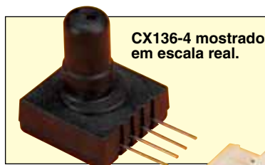
CX136-4 mostrado em escala real.