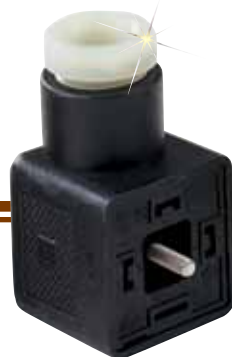
CX5300 mostrado em escala menor que a real.