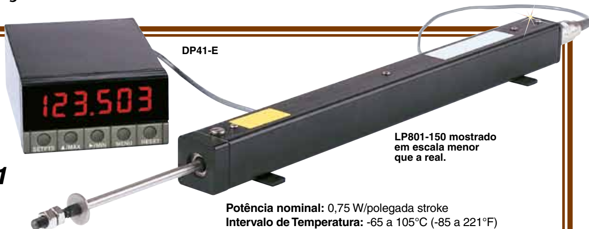
LP801-150 mostrado em escala menor que a real.