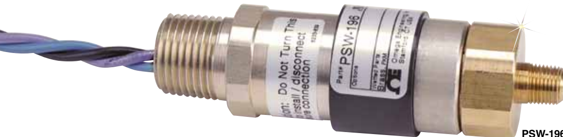
PSW-196, em tamanho real.

Para acessórios para alarmes sonoros e módulos de relés, acesse o site.