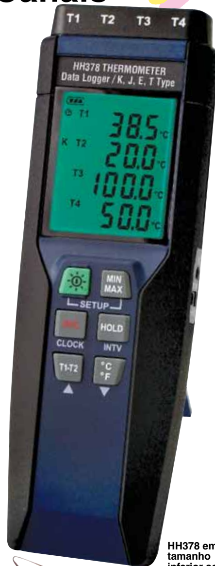
HH378 em tamanho inferior ao real.

O programa de garantia estendida OMEGACARE SM está disponível para os modelos mostrados nesta página. Consulte seu representante de vendas para obter todos os detalhes quando for fazer o seu pedido. O OMEGACARE SM oferece cobertura para peças, mão de obra e itens retornáveis equivalentes.