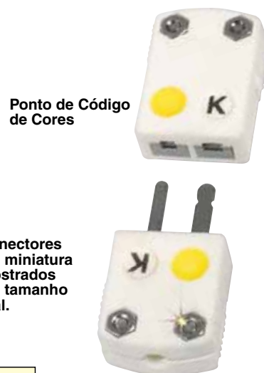
Ponto de Código de Cores