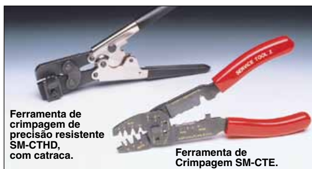
Ferramenta de crimpagem de precisão resistente SM-CTHD, com catraca.