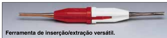
Ferramenta de inserção/extração versátil.