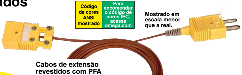
Cabos de extensão revestidos com PFA